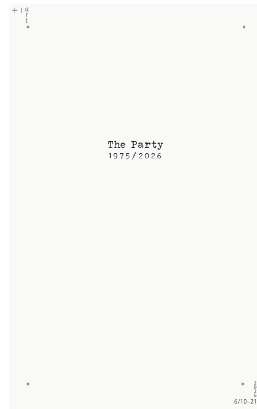
《The Party 1975/2026》案内フライヤー