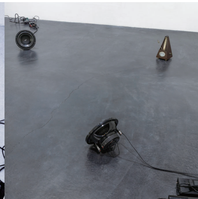
《The Party 1975/2026》 at Osaka