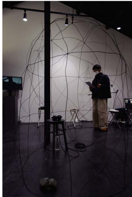
「無顔 FACELESS」2024 1/24-2/10,4 at +1art(大阪)