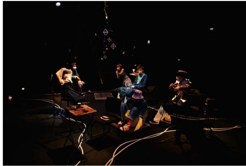
「かはたれ」2021 3/17,18 at THEATRE E9 KYOTO