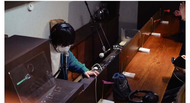
「ある12月から」2022 12/3,4 at +2 gallery(大阪)