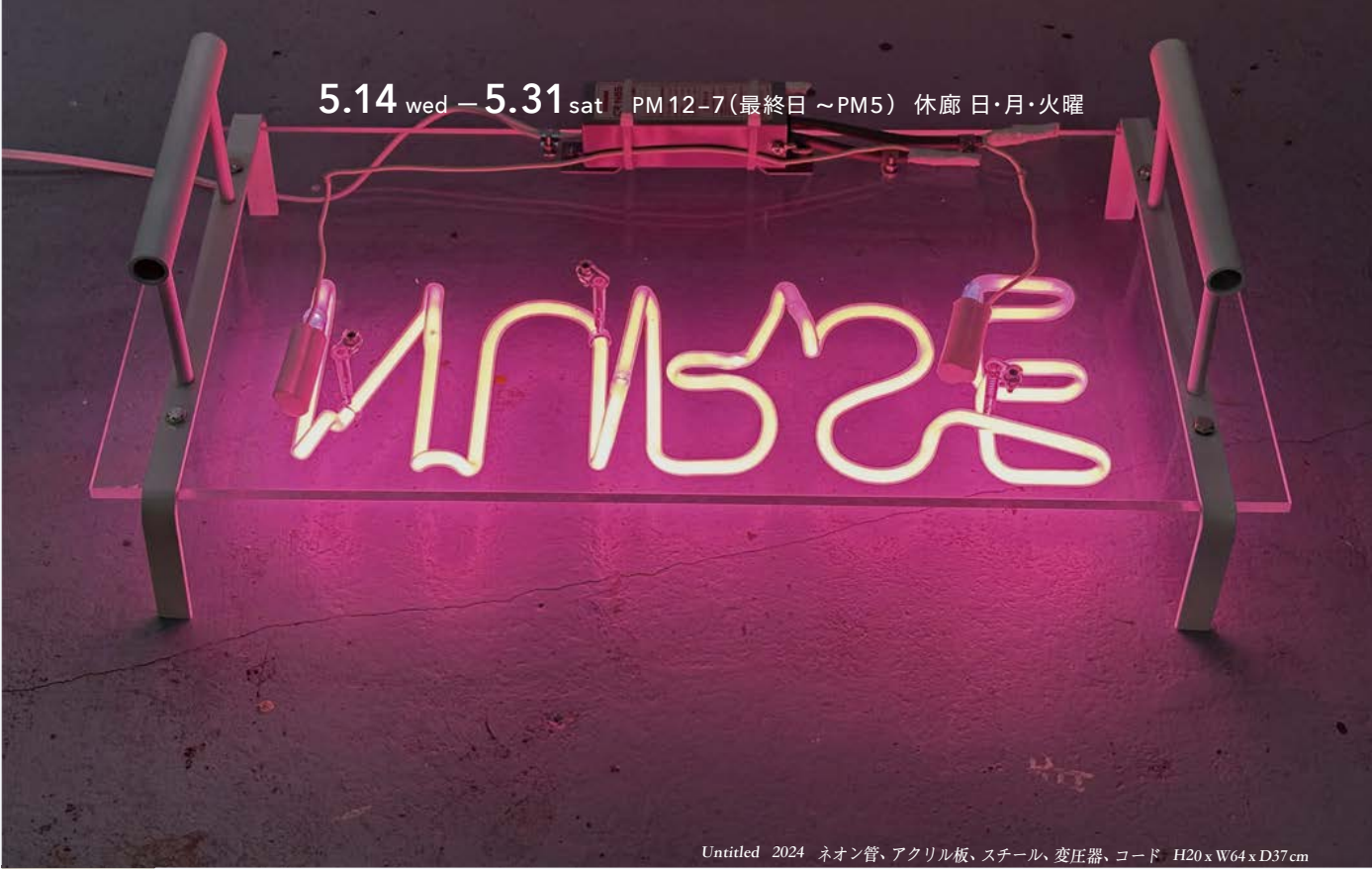
Untitled 2024 ネオン管、アクリル板、スチール、変圧器、コード H20 x W64 x D37 cm

5.14 wed - 5.31 sat PM 12-7 (最終日 ~PM5) 休廊 日・月・火曜