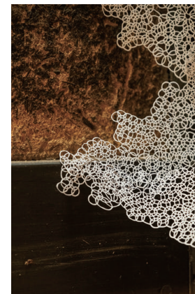
やがて時間から乖離する (部分) 紙 / サイズ可変 2024