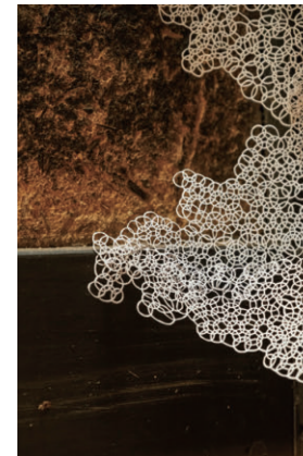
やがて時間から乖離する (部分) 紙 / サイズ可変 2024