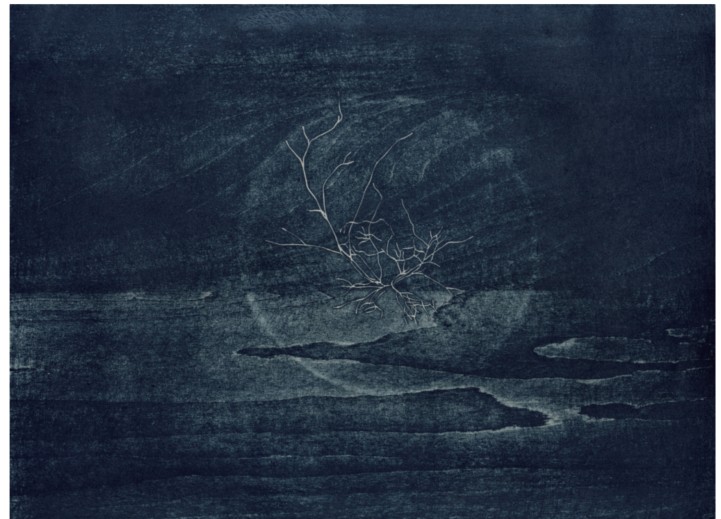
私の中に眠る自然 #2 木版画、和紙 / 240 x 330 mm 2025